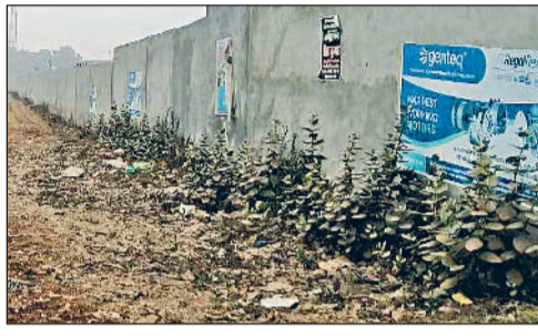
रेवाड़ी। जमीन के पास किया गया अस्थाई निर्माण।