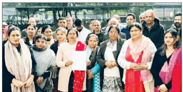
रेवाड़ी। ज्ञान दिखते हुए सोसायटी के निवासी।