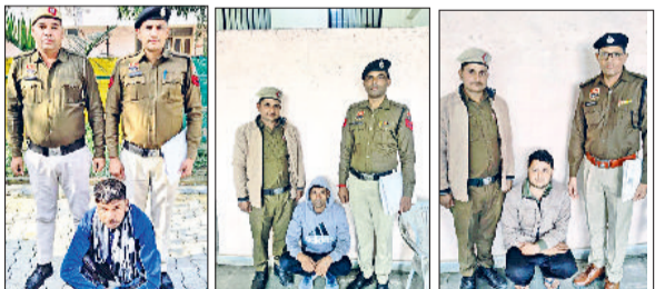
रेवाड़ी। विभिन्न मामलों में गिरफ्तार किए गए पीओ पुलिस टीमों के साथ।