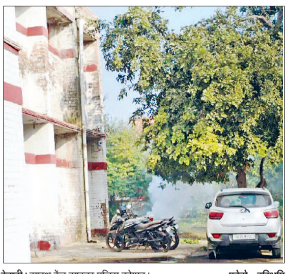
रेवाड़ी। साउथ रेंज साइबर पुलिस स्टेशन।

डेढ़ गुणा बढ़े ठगी के मामले, ठगों ने लोगों को जाल में फंसाने के लिए नए-नए हथकंडे तक अपनाने में कोई कसर नहीं छोड़ी नरेन्द्र वत्स ► रेवाड़ी