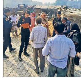
रेवाड़ी। झुंगियों में रहने वाले लोगों से पूछताछ करती पुलिस टीम।