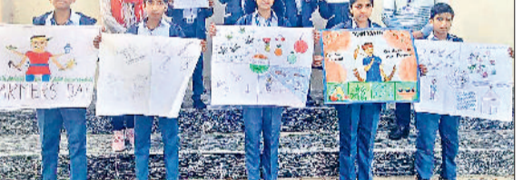
महेंद्रगढ़। बनाए हुए पोस्टर दिखाते विद्यार्थी।