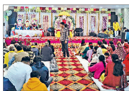
रेवाड़ी। कथा सुनाते हुए वाचक और सुनते हुए श्रद्धालु।

निकलने के बाद दिन भर कड़ाके की ठंड का असर गायब रहा। कोहरा पूरी तरह साफ हो गया, लेकिन शाम को एक बार फिर कोहरे के कारण वाहनों की गति मंद पड़ गई। मौसम विभाग के अनुसार 25 दिसंबर से मौसम में एक