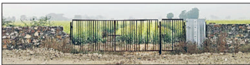
रेवाड़ी। आईडीटीआर की जमीन पर लगाया गया गेट।

आईडीटीआर सेंटर बनाने के लिए जमीनों का अधिग्रहण वर्ष 2006 में किया गया था। जिले में सेंटर बनाने के लिए लगभग 27.5 एकड़ जमीन नेशनल हाइवे के दोनों ओर अधिग्रहित की गई थी, अभी तक निर्माण नहीं हुआ और जमीन पर लोगों का कब्जा