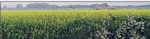
रेवाड़ी। अधिग्रहित जमीन पर लहलाहाती हुई सरसों की फसल।