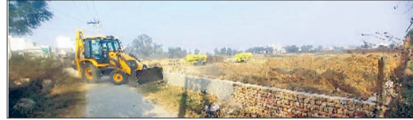
रेवाड़ी। अवैध कॉलोनी में दीवार तोड़ते हुए जेसीबी मशीन।

डीटीपी की टीम ने मंगलवार को गज्जीपुर की राजस्व सीमा में जेसीबी चलाकर वहां विकसित की जा रही अवैध कॉलोनी को जमींदोज कर दिया। पुलिस बल मौजूद होने के कारण डीटीपी की कार्रवाई का विरोध नहीं हुआ। डीटीपी की ओर से अवैध कॉलोनीयों की लिस्ट में गज्जीपुर की राजस्व सीमा भी शामिल थी। यहां लगभग चार एकड़ जमीन में कॉलोनी विकसित करने का कार्य किया जा