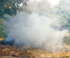
रेवाड़ी। एक सरकारी परिसर में कूड़े के ढेर में लगी आग से निकलता धुआं तथा सुबह आसमान में नजर आ रहा प्रदूषण।

रात के समय कड़ाके की ठंड और सुबह के समय कोहरा। दोपहर तक तेज धूप के कारण मौसम का गर्म मिजाज। सुबह प्रदूषण का खतरनाक स्तर। यह सब दिसंबर माह के अंत में देखने को मिल रहा है। मौसम में 25 दिसंबर से बदलाव की संभावना जताई जा रही है। इस दौरान साल के अंतिम दिनों में इंद्रदेव की मेहरबान हो सकते हैं। प्रदूषण कंट्रोल बोर्ड कूड़ा जलाने वालों के प्रति पूरी तरह उदार बना हुआ है, जिससे यह समस्या और गहरा रही है। मंगलवार को सुबह के समय घना कोहरा छाया रहा, जिससे वाहनों की रफ्तार मंद पड़ी रही। वाहन चालक लाइट जलाकर एक-दूसरे के पीछे चलते हुए नजर आए। आसमान में कोहरे के साथ धूल और धुआं की चादर भी बनी रही, जिससे सुबह के समय धारूहेड़ा का एक्वआई 379 दर्ज किया गया। लगभग 10 बजे बाद तेज धूप खिलते ही कोहरा गायब हो गया। अधिकतम तापमान 3.5 डिग्री बढ़कर