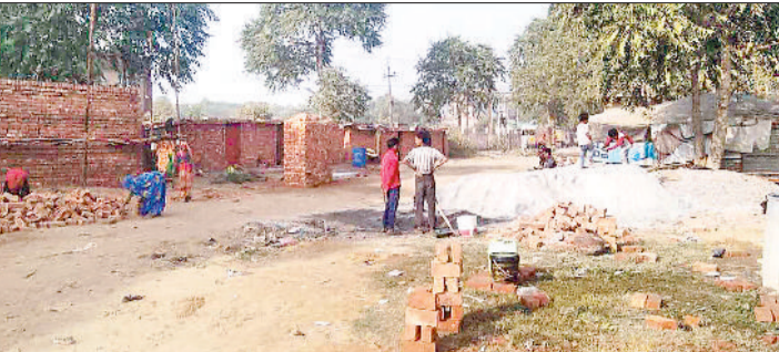
महेंद्रगढ़। नगर पालिका के नए भवन के लिए कार्य करते मजदूर।

ऑटो मार्केट के पीछे खाली जमीन पर नगर पालिका (नपा) की ओर से नया भवन बनाया जाएगा। ठेकेदार की ओर से भवन बनाने के लिए कार्य शुरू कर दिया गया। ठेकेदार द्वारा नपा के यह भवन 15 महीने में तैयार करके देना होगा। नगर पालिका की ओर से नए भवन के लिए तीन करोड़ 20 लाख रुपये खर्च किए जाएंगे। ठेकेदार की ओर से नए भवन को आधुनिक बनाया जाएगा। फिलहाल